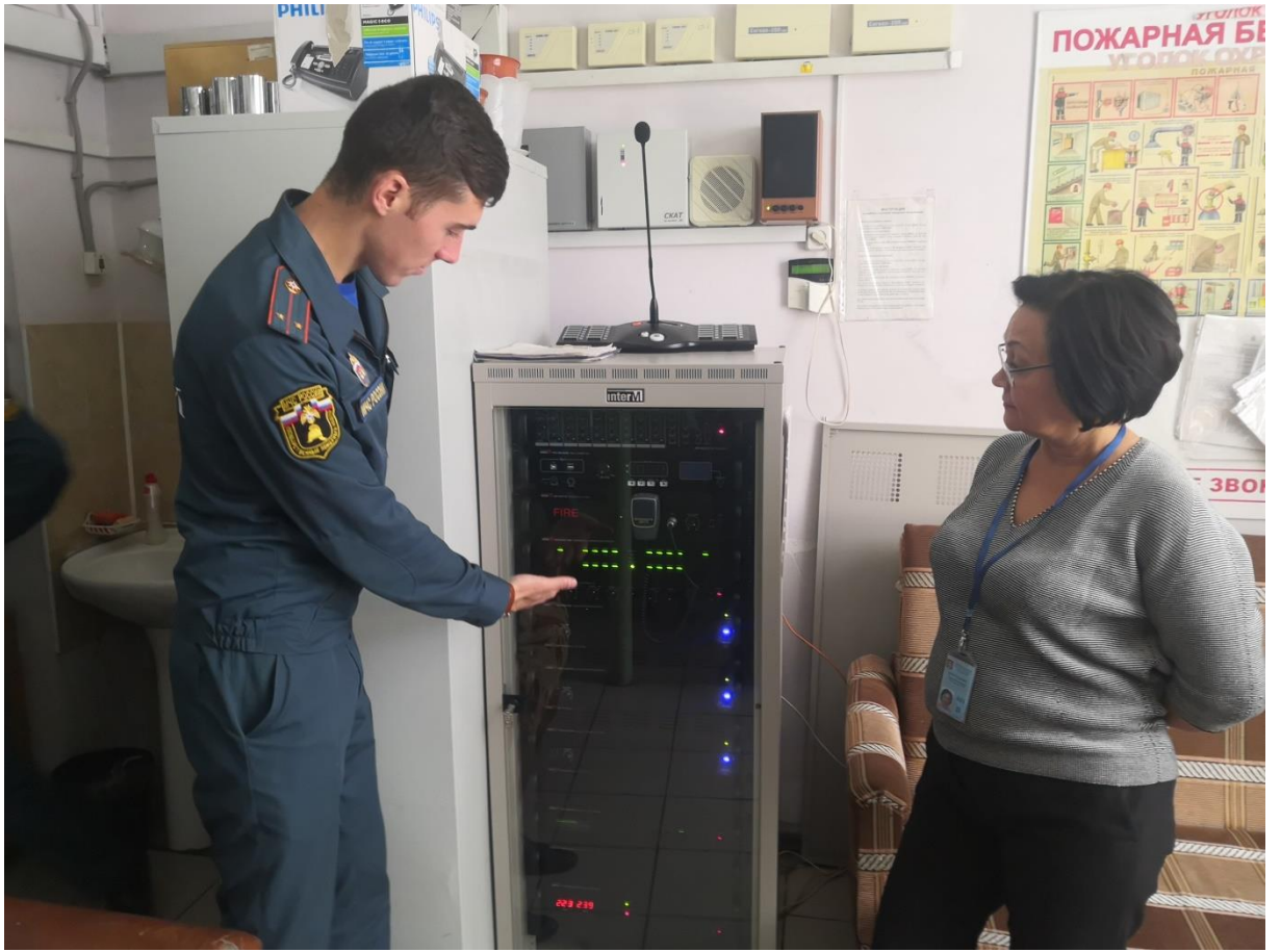
ОНДПР Центрального района 18.10.2019